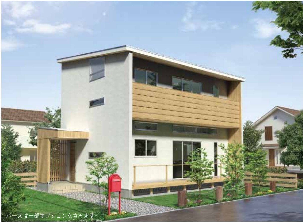
パースは一部オプションを含みます

CONCEPT HOUSE Style-Ware house Design & Plan