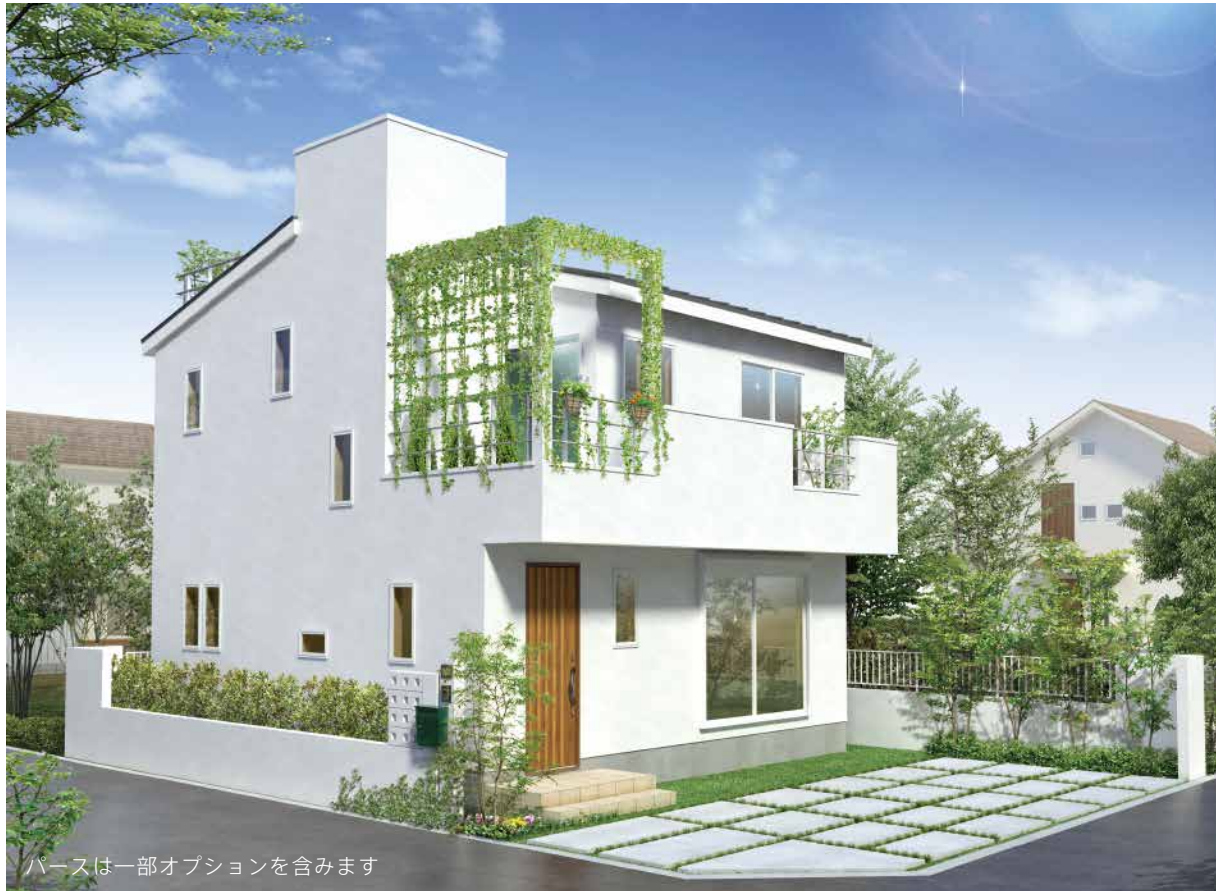
パースは一部オプションを含みます