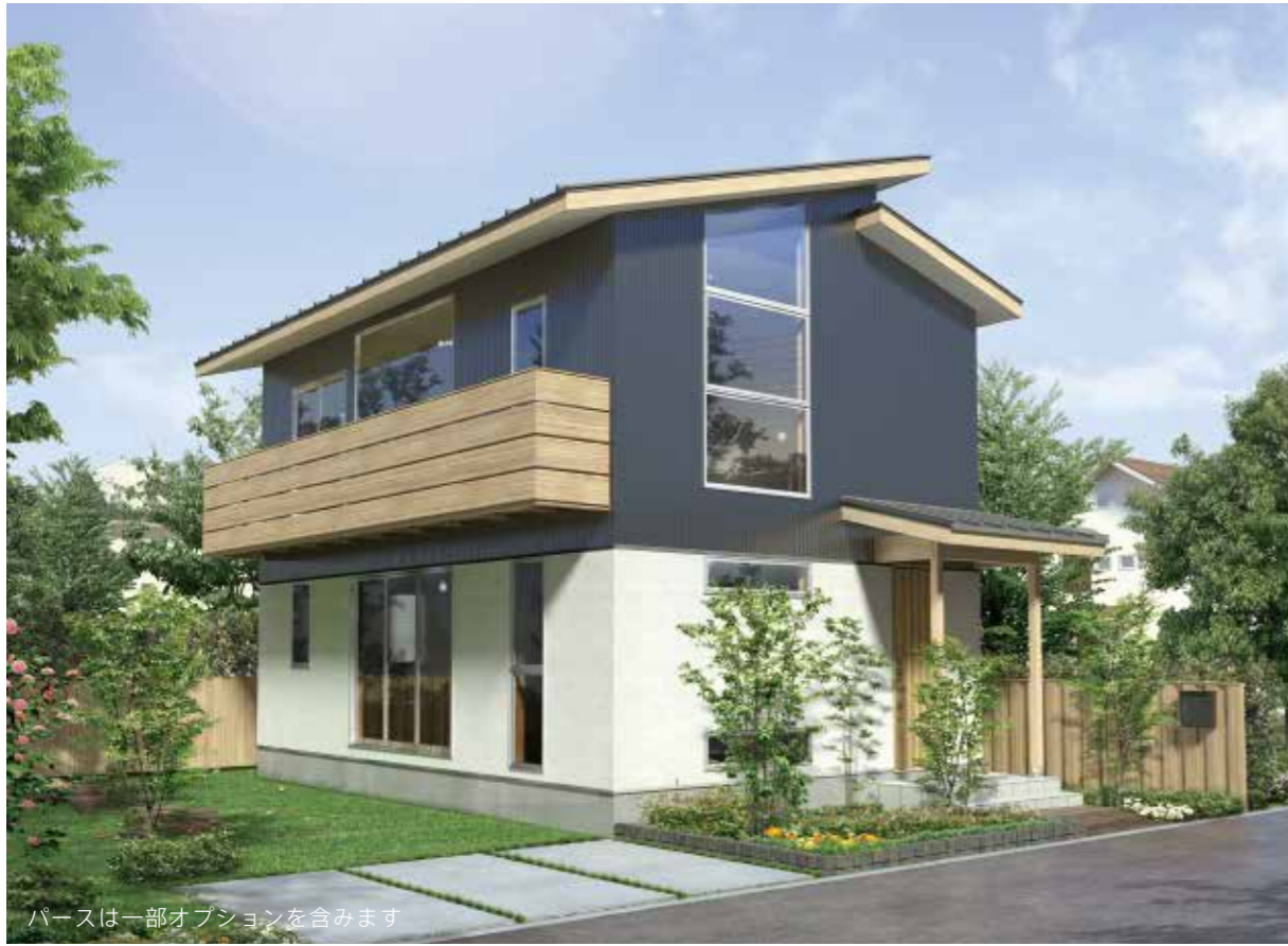
パースは一部オプションを含みます

CONCEPT HOUSE Style-Energy Design & Plan