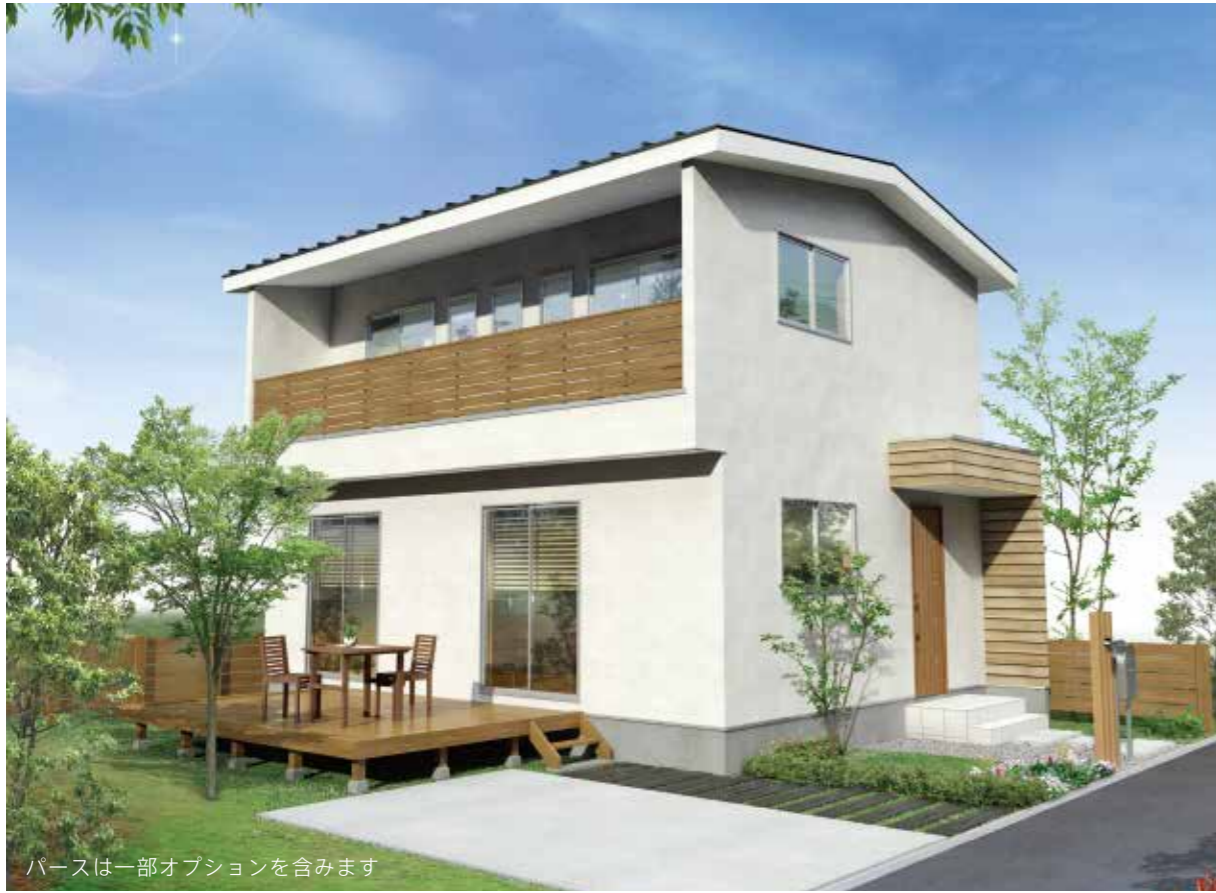
パースは一部オプションを含みます